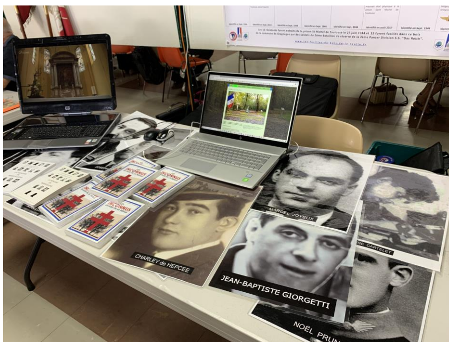
Le Stand du Groupe de Recherches