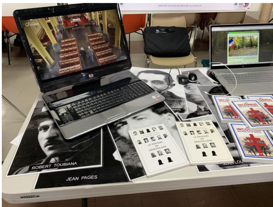
Le Stand du Groupe de Recherches